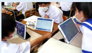
例：「ICTを活用した協働的な学習」

熊本大学教育学研究科では、学校現場のニーズを踏まえた研修用動画の開発を行いました。その成果を報告いたします。